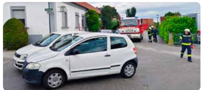
T1 - Bergung PKW 12. September