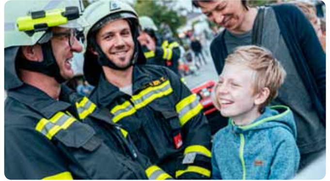
Branddienstübung beim Dorffest 13. September