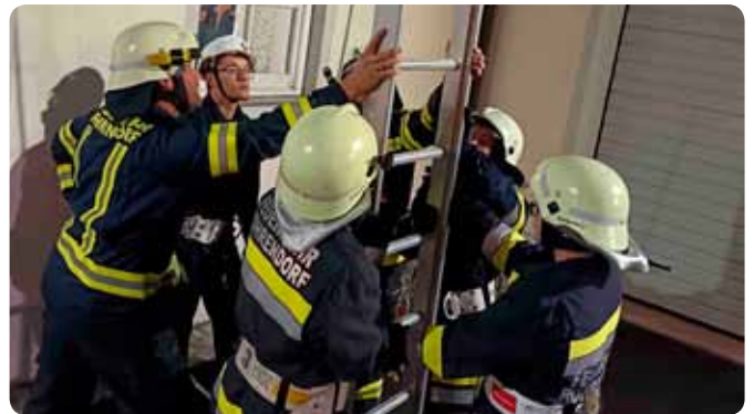
Arbeiten mit Leitern 26. September