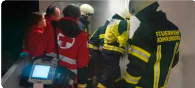
T1 – Notöffnung 23. April