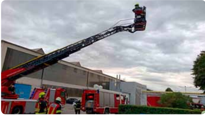
Übungsannahme: Brand in der Voestalpine Krems 05. September