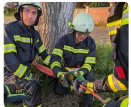
Technische Übung - Bergen von Fahrzeugen - 09. Mai