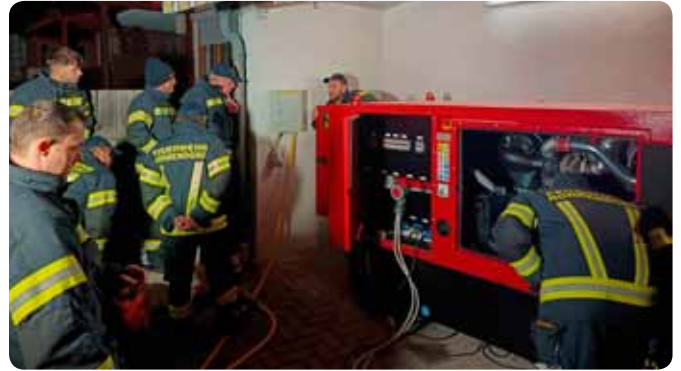
Schulung Notstromaggregat 28. Februar