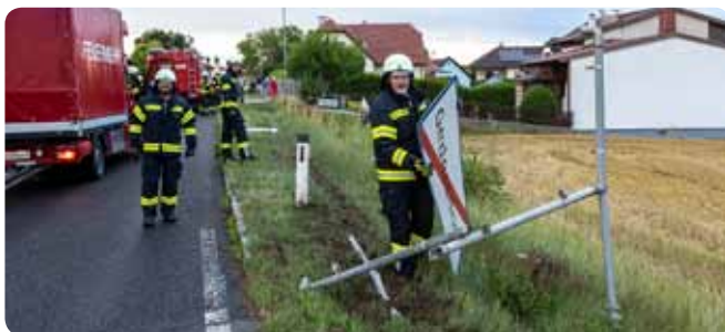
T2 - Verkehrsunfall 18. Juli