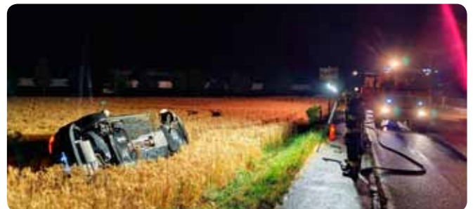
T1 – PKW - Bergung nach Verkehrsunfall 04. Juli