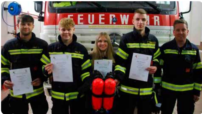
Ausbildungsoffensive in der FF Rohrendorf 25. September