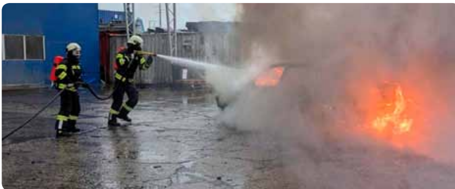
Einsatzübung im Hafen Krems 25. April