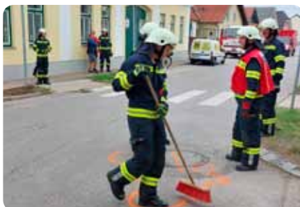
T1 - Bergung PKW in der Bahnstraße 13. September