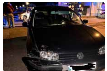
T1 Bergung PKW 26. Oktober