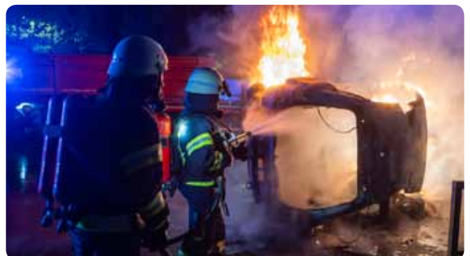
Einsatzübung mit mehreren Feuerwehren und dem Roten Kreuz - 23. Oktober