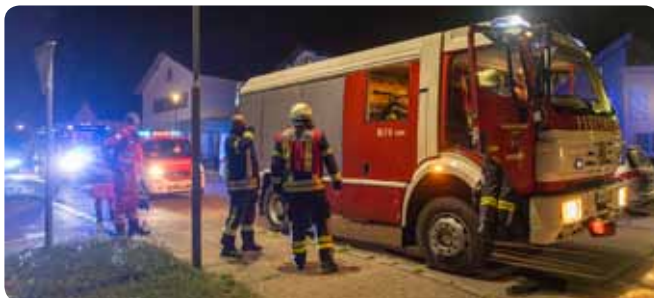
B2 - Gebäudebrand in der Admonterstraße 25. Juni