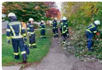
T1 - Sturmschaden / Baum umgestürzt - 24. Oktober