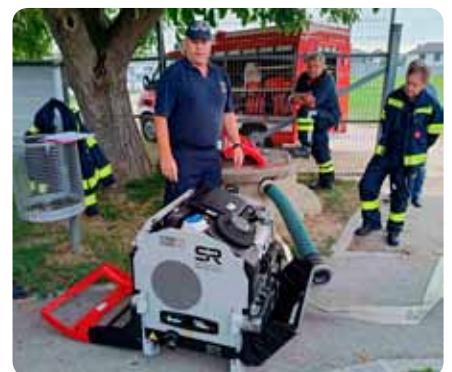
Einschulung auf die neue Tragkraftspritze 29. Aug., 25. + 28. Sept.