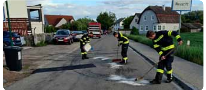
T1 - Ausgelaufene Betriebsmittel gebunden 19. Mai