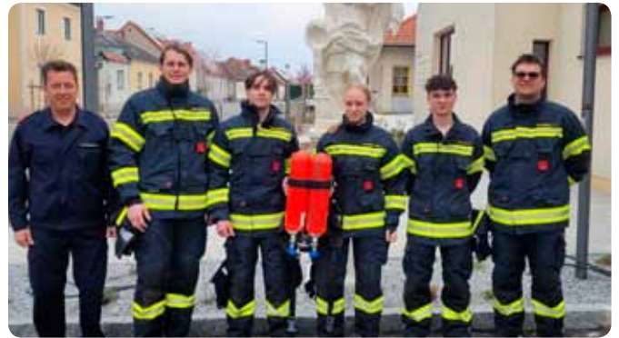
Neue Atemschutzträger ausgebildet 05. April