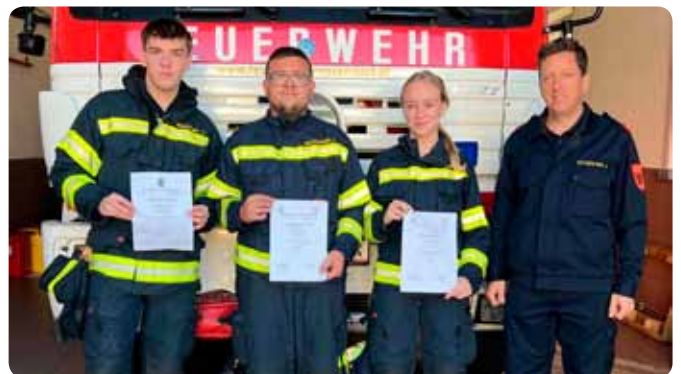
Abschluss des Ausbildungsmoduls NRD 20 und „Abschluss Truppmann“ - Herbst