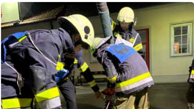
Übung „Löschgruppe Teil 1“ 17. Oktober