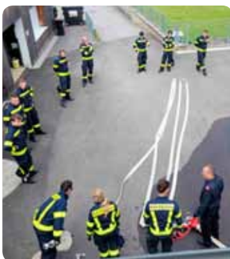
Übungstag Löschgruppe und Übergabe Katastropheneinsatzmedaille 24. Mai