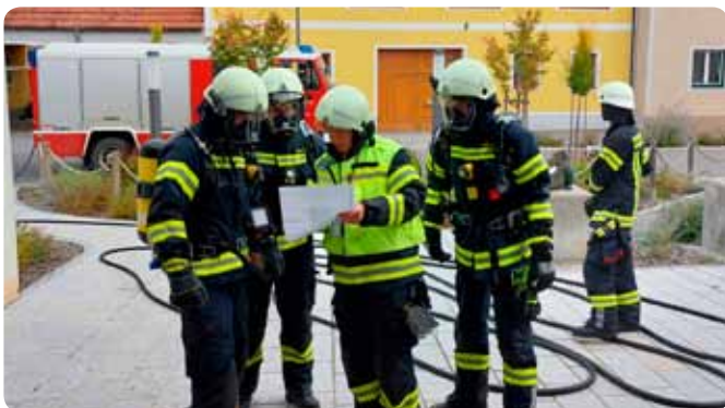
Kindergarten- / Räumungsübung 10. November