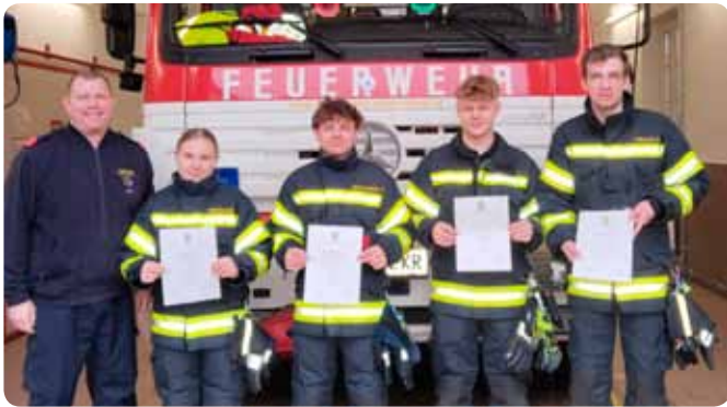
Modul „Abschluss Truppmann“ erfolgreich absolviert März