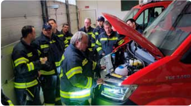
Einschulung Kommandofahrzeug Februar